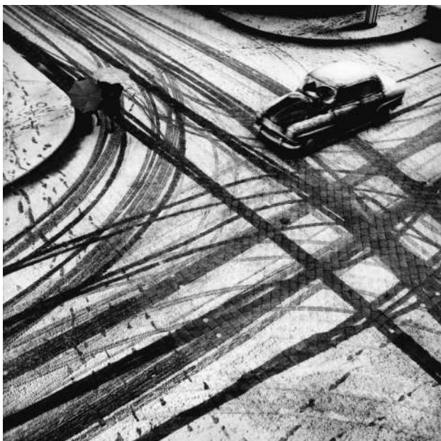
Jean-Claude Gautrand, Paris - Carrefour Paloi-Ricquet, 1957. Avec l'aimable autorisation de l'artiste

Les médiations proposées par le musée s'appuient sur le ressenti des élèves devant les images. Par leur approche basée sur l'interactivité et l'échange, les médiatrices mèneront les élèves à la rencontre des multiples facettes de ce photographe.