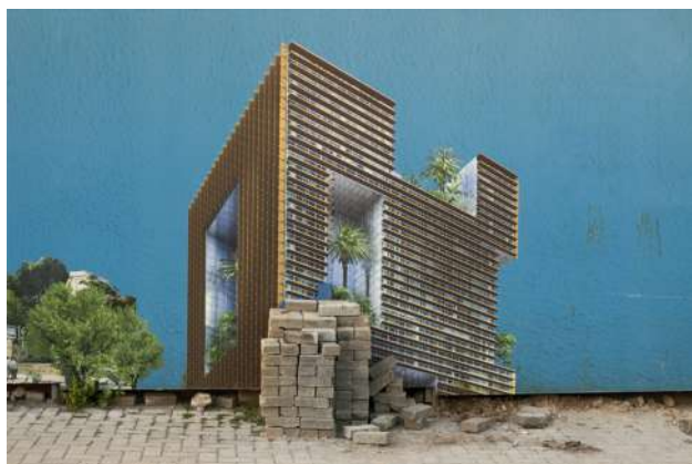
RANDA MIRZA. LA RESIDENCE SELECTIVE. SERIE BEIRUTŌPIA. 2019. AVEC L'AIMABLE AUTORISATION DE L'ARTISTE / TANIT GALLERY, MUNICH.

Lors de cette rencontre, elle fait découvrir son exposition en accompagnant les élèves à se questionner sur la réalité des images, le spectacle de la violence et les limites entre représentation et réalité.