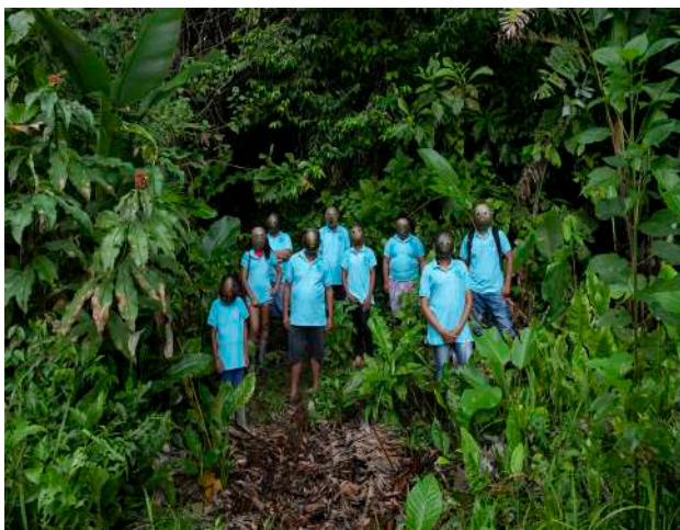
© SERGUARDIANES. AVEC L'AIMABLE AUTORISATION DE L'ARTISTE.

L'activité commence par un jeu ludique cartographiant le territoire à travers la découverte de plantes emblématiques, végétaux présents dans le travail des artistes exposés. Par la suite les élèves réalisent des prises de vue photographiques en se mettant à la place d'un explorateur dans un espace végétalisé. L'atelier invite les élèves à proposer un message environnemental et à sensibiliser par la photographie.