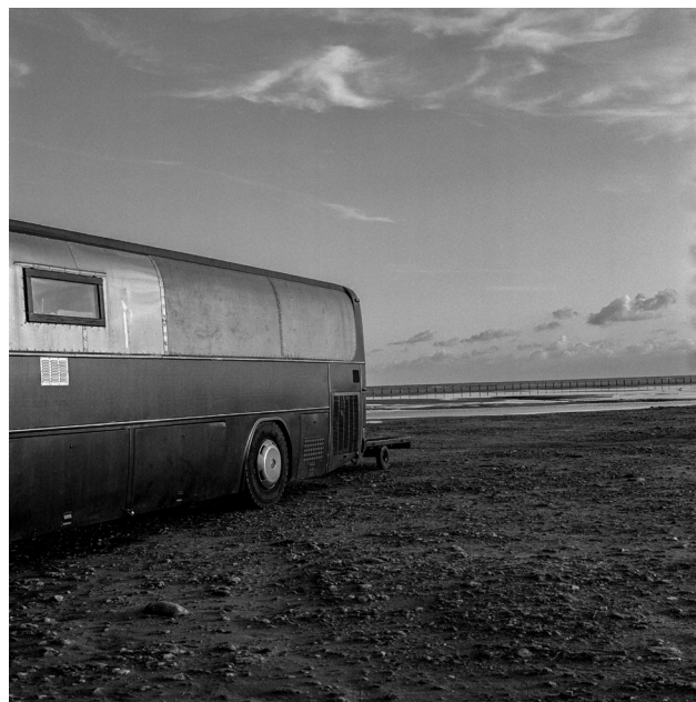
© ROMAIN BOUTILLIER - MUSÉE DE LA CAMARGUE. AVEC L'AIMABLE AUTORISATION DE L'ARTISTE.